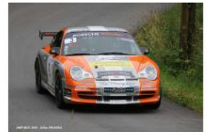
Pascal Ropers / Géraldine Robe

Engagés : 47 – Forfaits : 4 – Partants : 43 – Abandons : 15 – Classés : 28