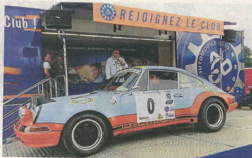
Une super-spéciale aura lieu samedi soir sur le boulevard des Championnats-du-Monde. Ici, la voiture ouverte historique au départ, en juin 2016.