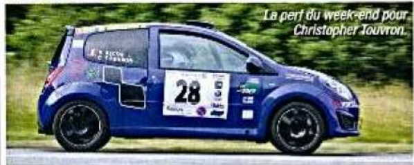
La perf du week-end pour Christopher Touvron.

NATIONAL 9-10 juin, 7e édition. Organisé par l'ASACO Océane et l'Écurie Morbihan Autosport. Ligue Bretagne-Pays de la Loire. Cof/total, 4, 43 participants, 28 classes. PODIUM ET GROUPES 1. Cosson-Hochfil (Peugeot 997 GT3) à 1'15"2 (1ers Gr. GT - et GT+15) - 2. Jézéquel L. e Foy (207 SX) à 2'37"8 (1ers Gr. A-FA et A75) - 3. Gardan-Fragno (106) à 3'1"1 (1ers Gr. F2000 et F214)... 7. Toussaint-Fleury (Peugeot R2) à 5'48"8 (1ers Gr. R et R2)... 10. Ropers-Ruber (Peugeot 996 GT3 RS) à 6'56"1 (1ers Gr. G1 et G11)... 12. D. Faurt - Drouot (Mégane RS) à 7'46"2 (1ers Gr. N-FN et FN4).