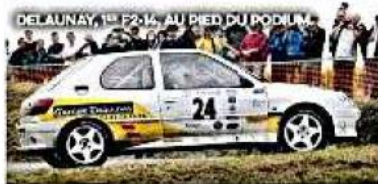
DELAUNAY, 1 er F214, AU PIED DU PODIUM.