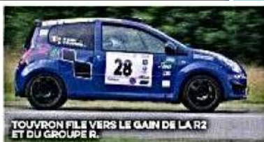
TOUVRON FILE VERS LE GAIN DE LA R2 ET DU GROUPE R.