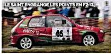
LE SAINT ENGRANGE LES POINTS EN F212.